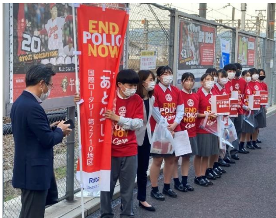
約 50 名のインターアクトも参加

今回の事業は、国際ロータリーが長年にわたって続けているポリオ（小児まひ）根絶のための活動（エンドポリオキャンペーン）と、ロシア軍の侵攻を受けるウクライナにおいて被害を受けた方々への支援を目的として行われました。