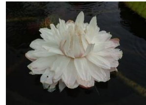
開花 2 日目

パラグアイオニバスの花は、夏の夜に2日間だけ咲く「二日花」で、1日目は開花する前から桃のような甘い匂いを出し、白い花を咲かせます。翌朝には一度閉じてまた夕方に花開きます、この時、匂いはなく、花びらがうっすらとピンクがかかった色になります。パラグアイオニバスは虫が受粉の手伝いをしてくれる花で、遺伝子の多様性を確保するために他花受粉を促すための植物の知恵です。