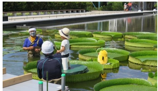
8月11日(木・祝)植物園イベント「パラグアイオニバスに乗ろう」

パラグアイオニバスの花は、夏の夜に2日間だけ咲く「二日花」で、1日目は開花する前から桃のような甘い匂いを出し、白い花を咲かせます。翌朝には一度閉じてまた夕方に花開きます、この時、匂いはなく、花びらがうっすらとピンクがかかった色になります。パラグアイオニバスは虫が受粉の手伝いをしてくれる花で、遺伝子の多様性を確保するために他花受粉を促すための植物の知恵です。