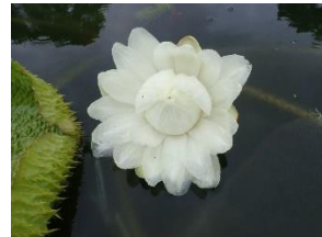
開花 1 日目